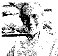
L'AUDITORIUM Renzo Piano ha progettato l'Auditorium