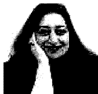
IL MAXXI Zaha Hadid ha progettato il Maxxi