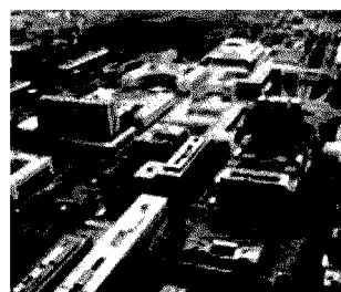
Eur «Ci vuole l'Arco trionfale» di Libera»

Sogno un Foro Italoico bis a Tor di Quinto, con un ponte che lo colleghi all'Acqua Acetosa