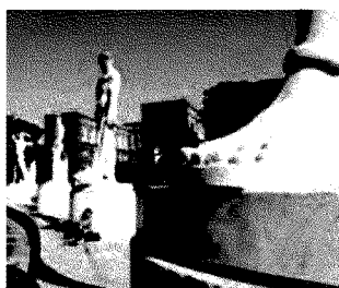
Foro Italoico «Fermare le speculazioni»