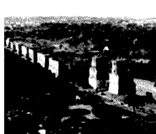
Mura Aureliane «Un percorso unificato»